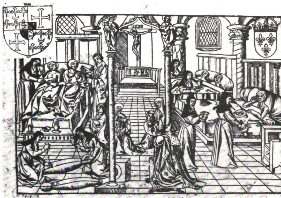
Interieur van het Hôtel-Dieu in Parijs. Houtsnede omstreeks 1500.