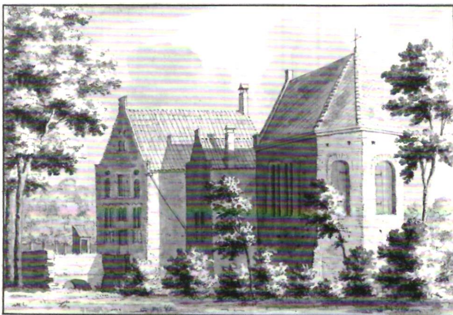
L.P. Serrurier, Het melatenhuis aan de Hogeweg omstreeks 1730. Rijksarchief Utrecht.

schiedenis gedaan. Voor zieke kinderen moest het algemeen vigerende systeem van verzorging door particulieren soelaas bieden; voor epileptici en andere ongeneeslijk geachte razenden zullen faciliteiten in de vorm van dolhuisjes en raashokken de nood hebben moeten lenigen, en voor de leprozen zouden de regenten zelf maatregelen nemen om een geschikte accommodatie te vinden. Dat laatste leidde in 1416 tot de opening van een melatenhuis, even buiten de Kamperbuitenpoort, waar ieder werd toegelaten die een medisch attest of vuilbrief kon tonen, waarin deskundigen de niet zo zeer besmettelijk geachte als wel afzichtelijke en daarmee vooral emotioneel-infecterende ziekte werd vastgesteld. Wat bleef waren de chronische zieken; de acute zieken waren het voorwerp van zorg en behandeling van de vertegenwoordigers van het medische beroepen geworden, of beter: van de medische beroepen die zich gaandeweg in Amersfoort vestigden. 7) Voor deze