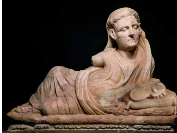
Fig. 3. Urn in het Archeologisch Museum in Volterra met op de deksel een haruspex (waarzegger) die in zijn linker hand een schapenlever houdt. Hij toont de viscerale zijde van de lever aan de toeschouwer waardoor deze de lever omgekeerd ziet, met de fundus van de galblaas naar beneden.

te zien, namelijk met de fundus van de galblaas naar beneden gericht, zoals ook in het bronzen model uit Piacenza.