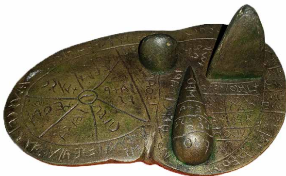
Fig. 1. Etruskische bronzen model (7.5x12.5cm) van een schapenlever (ca 100 v.Chr.) gevonden nabij Piacenza, die door waarzeggers werd gebruikt voor het voorspellen van de toekomst. (Musei Civici di Palazzo Farnese, Piacenza, Italië)