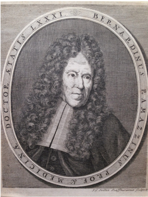
Figuur 1. Portret uit Opera Omnia 1717.

den. De later bekende grondlegger van de pathologische anatomie Giovanni Battista Morgagni (1682-1771), wordt in 1711 op 29-jarige leeftijd de naaste collega van Ramazzini en bekleedt de secundaire leerstoel van de medische theorie. Ramazzini's gezondheid neemt ondertussen geleidelijk af; hij is blind geworden, heeft sinds 1702 hartklachten en lijdt aan hevige hoofdpijnaanvallen. Ramazzini dicteert de aangevulde editie van zijn eerder verschenen arbeidsgeneeskundig werk aan zijn kleinzonen en laat dit boek in 1713 uitbrengen. Net voor het vertrek naar de universiteit om college te geven, wordt hij getroffen door een hersenbloeding ( apoplexia ). Collega's, waaronder Morgagni, schieten hem thuis te hulp. Echter, binnen twaalf uur overlijdt Bernardino Ramazzini. Hij wordt begraven in een kerk in Padua. Morgagni beschrijft de dood van Ramazzini als casus in zijn beroemd geworden standaardwerk met honderden obductierapporten. 1