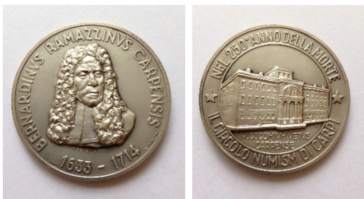
Figuur 4. Gedenkpenning 250 jarig overlijden van Bernardino Ramazzini in 1964.