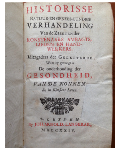
Figuur 3. Titelblad Nederlandse editie 1724.