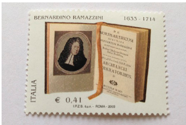
Figuur 5. Postzegel.

is het gedachtegoed van Ramazzini wereldwijd toegankelijker voor medisch historisch onderzoek. In 1964 en 1983 verschijnen gelegenheidsedities van Wrights vertaling (figuur 4). Inmiddels is de trend gezet regelmatig overal ter wereld over Ramazzini te schrijven.